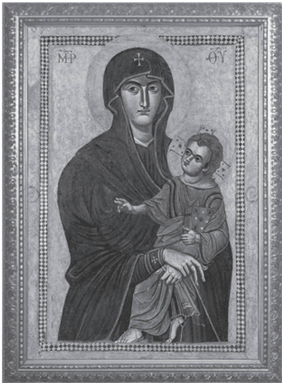
3. Autor nieznany, Salus Populi Romani , XII w., olej na desce, Santa Maria Maggiore , © Wikimedia commons