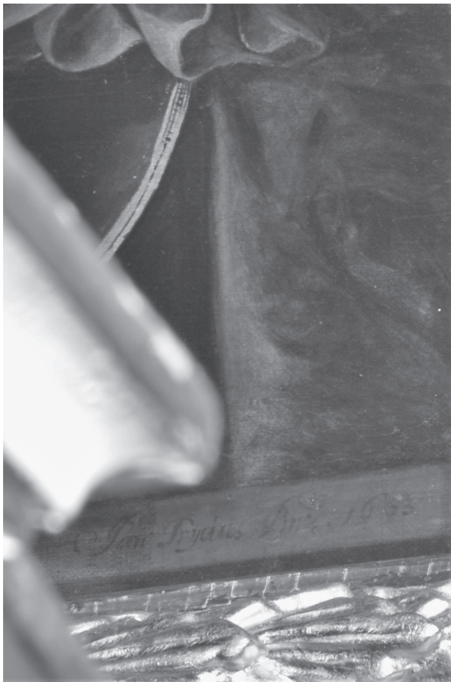
4. Jan Trycjusz, Matka Boska Śnieżna , 1663, olej na płótnie, kościół pw. św. Wawrzyńca w Strzelcach Opolskich, fot.: A. Kozieł (detal)