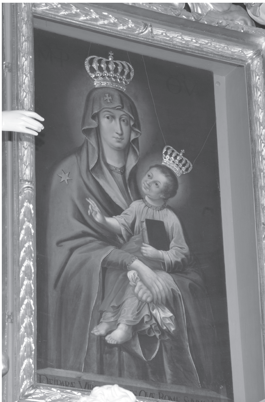
2. Jan Trycjusz, Matka Boska Śnieżna , 1663, olej na płótnie, kościół pw. św. Wawrzyńca w Strzelcach Opolskich, fot.: A. Kozieł