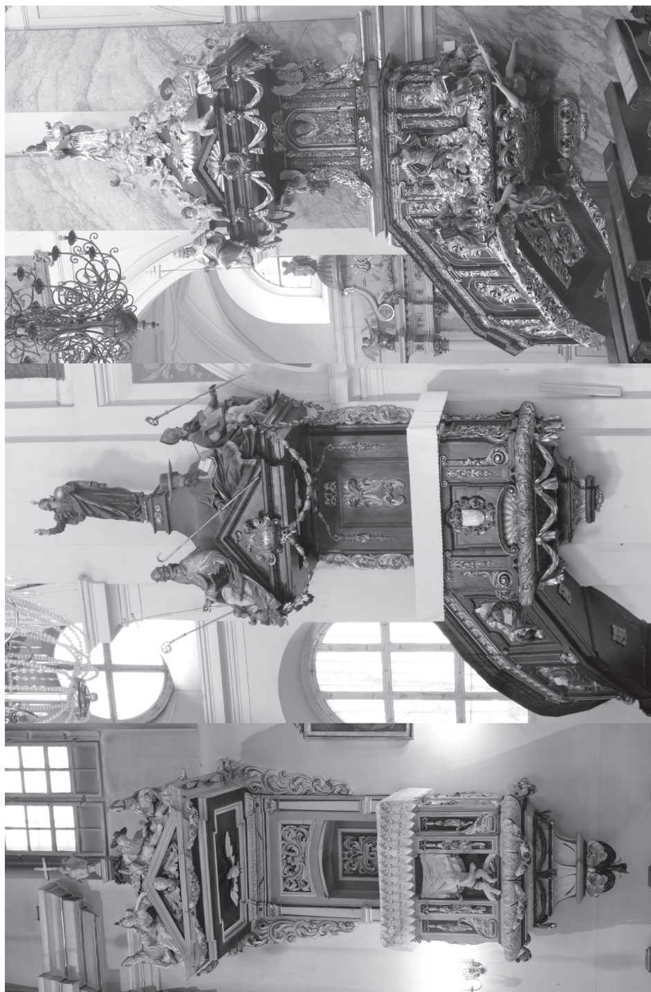
2a. [lewa] Rzeźbiarz śląski, ambona w kościele św. Jerzego w Prószkowie, l. 90. XVII w. Fot. A. Kolbiarz. 2b. [środek] Johann Joseph Weiss (?), ambona w kościele św. Mikołaja i Franciszka Ksawerego w Otmuchowie, 1693 r. Fot. A. Kolbiarz. 2c. [prawa] Rzeźbiarz śląski, ambona w kościele Nawiedzenia NMP w Bardzie, 1698 r. Fot. A. Kolbiarz.