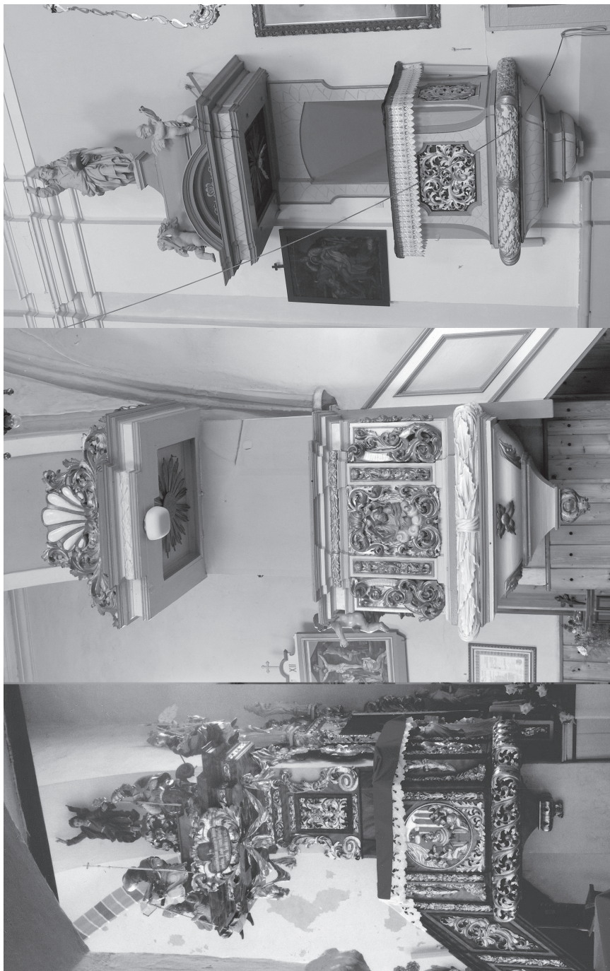
3a. [lewa] Rzeźbiarz śląski, ambona w kościele Wniebowstąpienia Pana Jezusa w Jaszkołtu, ok. 1700 r., Fot. A. Kolbiarz. 3b. [środek] Rzeźbiarz śląski, ambona w kościele św. Jadwigi w Węgrach, 1703 r. Fot. A. Kolbiarz. 3c. [prawa] Warształ lubiąski i Matthäus Knote (rzeźby), ambona w kościele św. Jadwigi w Łososiuwicach, ok. 1700 r. (rzeźby pomiędzy 1669, a 1676 r.). Fot. A. Kolbiarz.