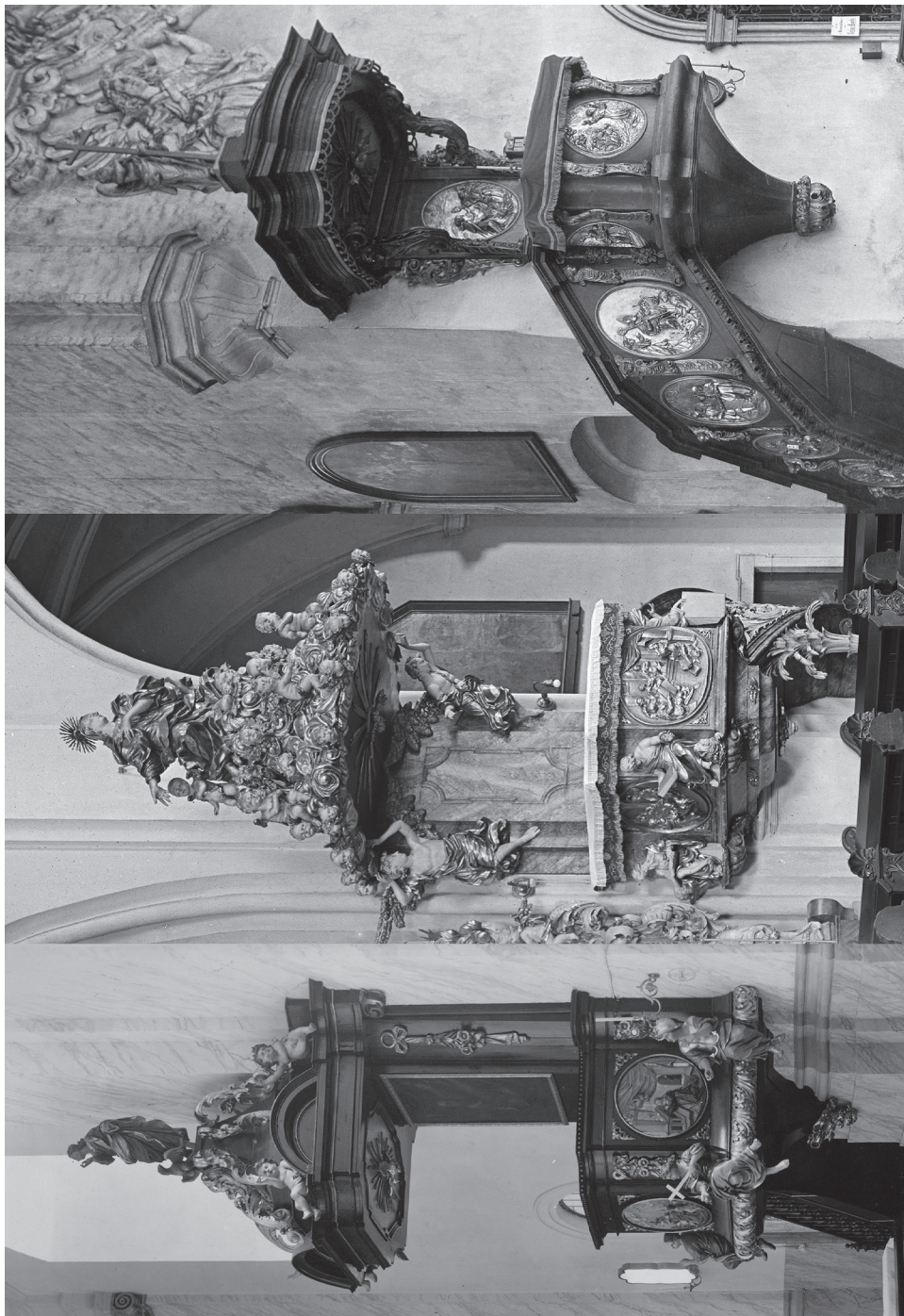
7a [lewa] M. Kössler, ambona w kościele śś. Klary i Jadwigi we Wrocławiu, ok. 1700 r. Stan sprzed 1945 r. 7b [środek] Rzeźbiarz wrocławski, ambona w kościele Bożego Ciała we Wrocławiu, 1. lub 2. dekada XVIII w. Stan sprzed 1945 r. 7c [prawa] Rzeźbiarz wrocławski, ambona w kościele św. Wojciecha we Wrocławiu, 1. lub 2. dekada XVIII w. Stan sprzed 1945 r.