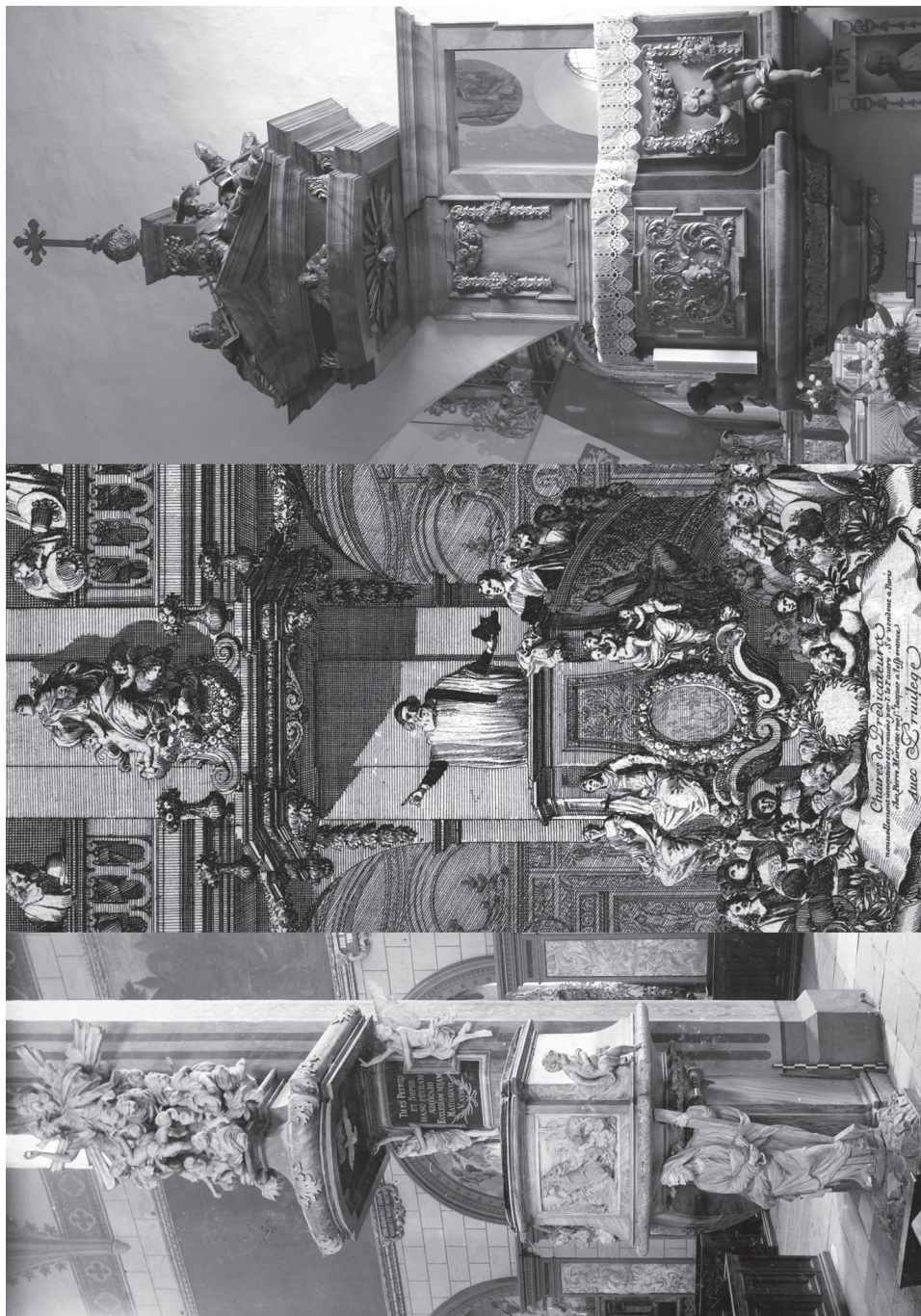
5a. [lewa] Rzeźbiarz śląski, ambona w kościele kolegiackim w Głogowie, 1697 r. Stan sprzed 1945 r. Fot. Herder Institut Marburg, sygn. 82232. 5b. [środek] Jean Le Pautre, rycina z wizerunkiem ambony. 5c. [prawa] Rzeźbiarz głogowski, ambona w kościele św. Marcina w Świdnicy k. Zielonej Góry, 2. lub 3. dekada XVIII w. Fot. A. Kolbiarz.