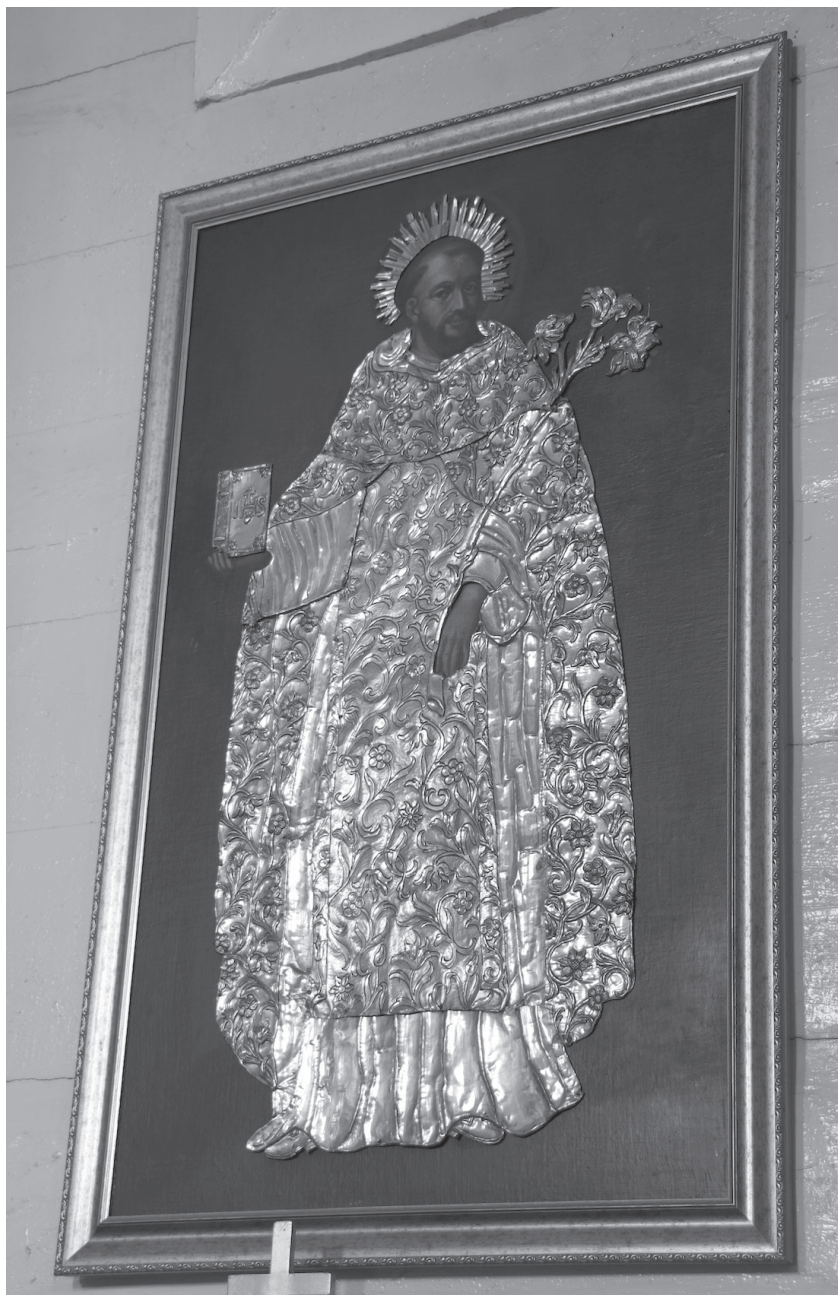
Il. 3. Obraz św. Dominika w srebrnej sukience w kościele pw. św. Zofii Wdowy w Zofiborze, fot. Tomasz Rolski