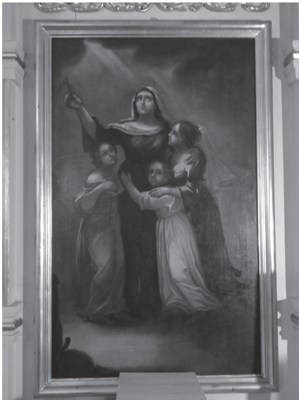
Il. 1. Obraz św. Zofii w kościele pw. św. Zofii Wdowy