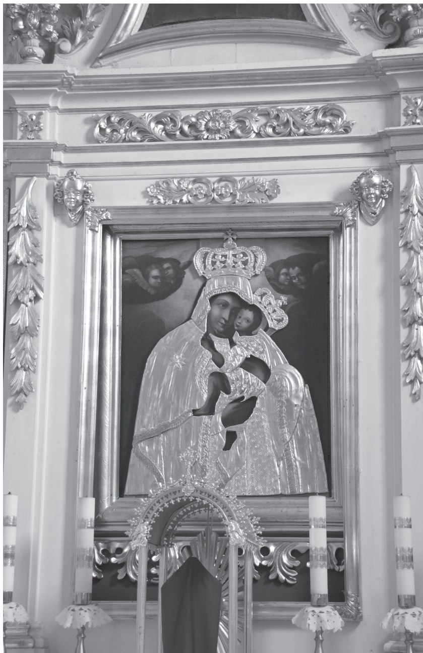
Il. 2. Ołtarz główny z obrazem Matki Boskiej z Dzieciątkiem w kościele pw. św. Zofii Wdowy w Zofiborze