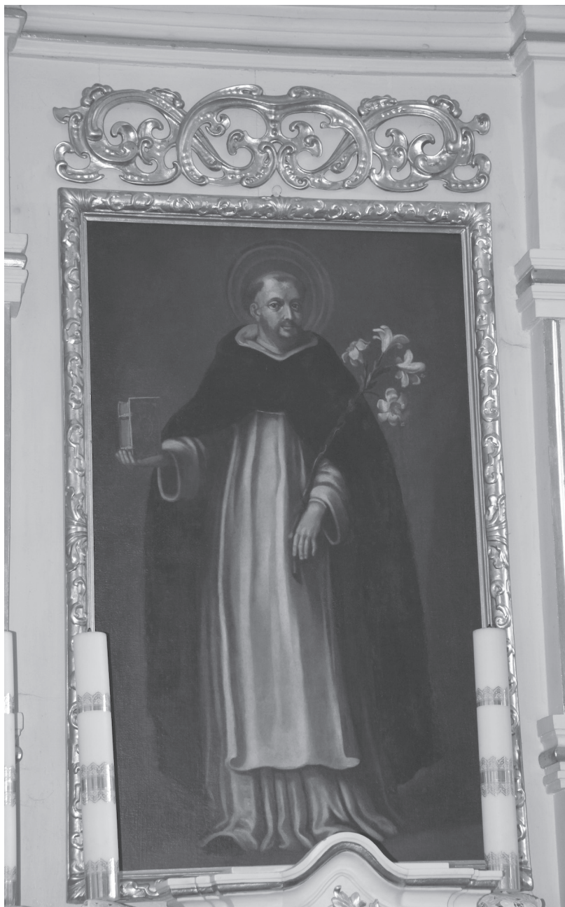
Il. 4. Obraz św. Dominika w kościele pw. św. Zofii Wdowy w Zofiborze