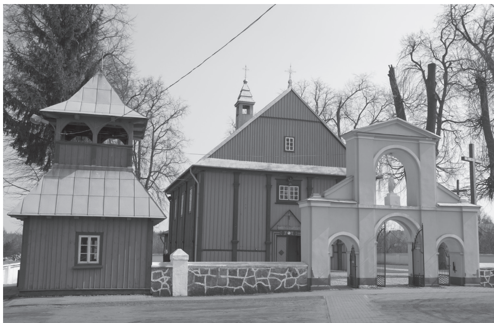
Il.7. Dawny kościół dominikański pw. św. Zofii w Zofiborze, fot. Tomasz Rolski