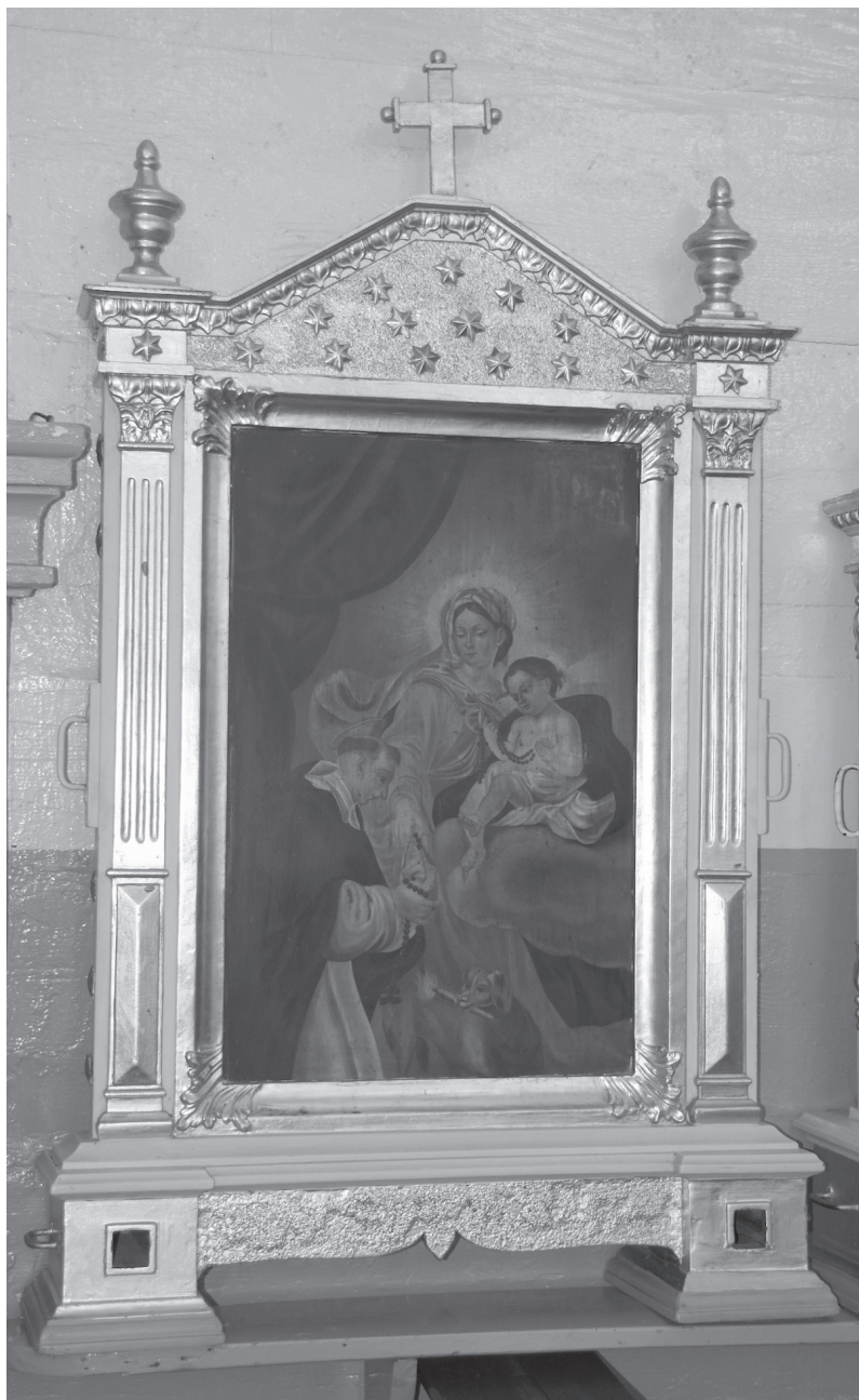
Il. 6. Feretron z obrazem Matki Boskiej Różańcowej ze św. Dominikiem w kościele pw. św. Zofii Wdowy w Zofiborze, fot. Tomasz Rolski