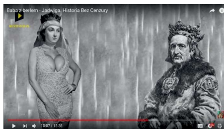
Ryc. 3. (J)

Zarówno w werbalnym opisie postaci, jak i w warstwie wizualnej nie brakuje karykatur i przerysowanych obrazów. Za przykład niech posłuży fotomontaż, na którym przedstawiono wizerunek królowej Jadwigi z doklejonym ciałem kobiety z mocno wyeksponowanym dużym biustem, ubranej w skąpą sukienkę. W przywoływanym filmie mąż Jadwigi, Władysław Jagiełło, mówi do małżonki: „Ooo, kochana, masz zamiar tak wyjść z zamku? Jesteś królem, a nie jakąś lafiryndą!” (ryc. 3).