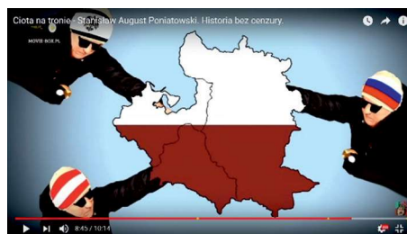
Ryc. 4. (SAP)

W analizowanym programie w zakresie uwspółcześniania przekazu wykorzystuje się również tematy efemeryczne, zaledwie chwilowo popularne w mediach. Dzieje się tak w głośnej medialnie sprawie „chytrej baby z Radomia”. W 2012 r. pewna kobieta została uchwycona przez kamery telewizyjne, gdy podczas miejskiej wigilii zabierała ze stołu napoje przeznaczone do wspólnego spożycia. Opinia publiczna napiętnowała to zachowanie. Wykorzystali to twórcy „Historii bez Cenzury”, porównując kobietę do zaborców Rzeczypospolitej. „Chytra baba z Radomia” występuje w programie, mając na głowie czapki w barwach Rosji, Austrii i Prus (zob. ryc. 4).