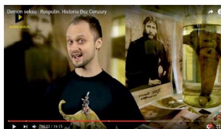
Ryc. 2. (R)