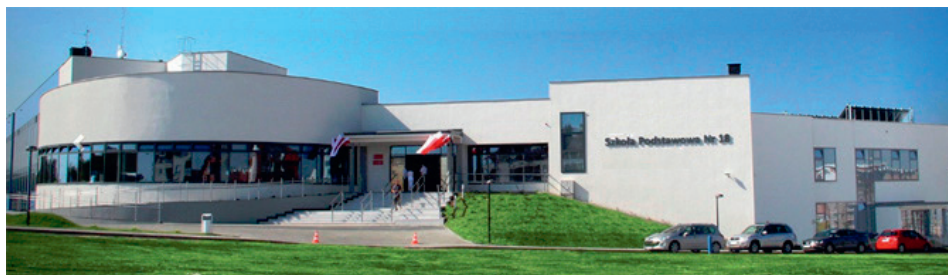
Ryc. 3. Kompleks oświatowy przy ul. Bł. Karoliny na osiedlu Przybyszówka (koszt 50 mln zł)