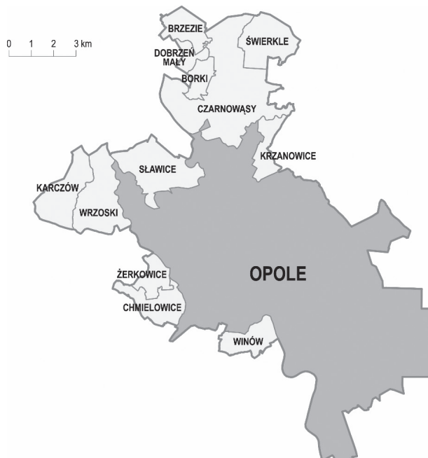
Ryc. 6. Tereny przyłączone do Opola od 1.01.2017 r.

sołectwo Chmielowice i sołectwo Żerkowice z gminy Komprachcice (łącznie 5,3 km 2 ) oraz sołectwo Winów z gminy Prószków (2,8 km 2 ) 9 (rycina 6). Łącznie powierzchnia Opola uległa powiększeniu o ponad 52,3 km 2 (z 96,4 do 148,8 km 2 ), a liczba ludności zwiększyła się ze 119 do 128 tys. osób.