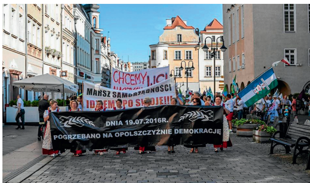
Ryc. 8. Marsz samorządności w Opolu w marcu 2017 r.