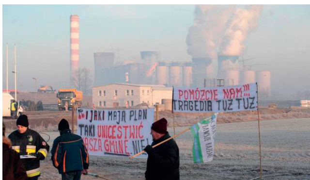
Ryc. 9. Manifestacja w Dobrzenu Wielkim