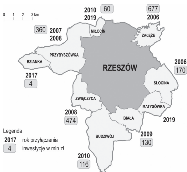
Ryc. 2. Zmiany terytorialne Rzeszowa w latach 2006–2019 oraz koszty inwestycji na nowych osiedlach

Rezultatem włączenia sąsiednich terenów w latach 2005–2019 jest wzrost powierzchni miasta o 72,88 km 2 (z 53,7 do 126,6 km 2 ) i liczby ludności o 35 tys. (ze 159 do 194 tys.). Nowo przyłączone tereny zyskują status osiedli. Władze miasta prowadzą tam zakrojone na szeroką skalę inwestycje (rycina 2).