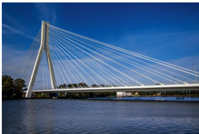
Ryc. 4. Most im. T. Mazowieckiego łączący ul. Załęską z Lubelską na osiedlu Załęże (koszt 178 mln zł)

z miastem. Łącznie na nowo przyłączonych terenach zainwestowano prawie 2 mld złotych (tyle, ile wynosiła kwota alokacji dla całego województwa podkarpackiego w ramach ZPORR 2004–2006) 3 . Najwięcej inwestycji poczyniono na osiedlu Załęże, gdzie przeznaczono je m.in. na modernizację i rozbudowę oczyszczalni ścieków, budowę łączników do autostrady A4 i mostu im. Tadeusza Mazowieckiego (rycina 4) oraz osiedlu Zwiężczyca, m.in. na rozbudowę i modernizację Zakładu Uzdatniania Wody (rycina 5) i budowę łącznika do drogi krajowej S19) 4 .