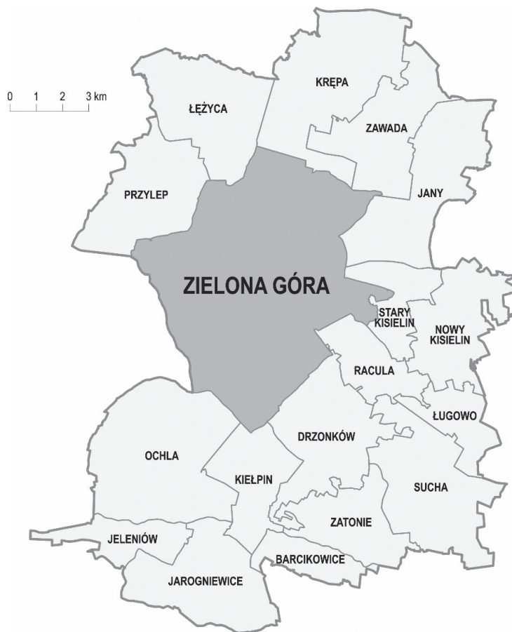
Ryc. 11. Struktura administracyjna miasta Zielona Góra po 1.01.2016 r.

Góra. Ustalenia te dotyczyły m.in. obniżenia stawek podatków (do najniższego poziomu obowiązującego w mieście lub gminie) i opłaty adiacenckiej (z 50% do 1%) czy zrównania cen biletów autobusów MZK ze stawkami miejskimi. Mieszkańcom gminy zagwarantowano też możliwość korzystania z licznych zniżek w ramach Karty ZGranej Rodziny i ZGranych Zielonogórczan oraz ZGrani 50+. Bez zmian miały pozostać nazwy sołectw i adresy, co miało wyeliminować konieczność zmian dokumentów. Ponadto wykazano, że za zgodne połączenie Miasta i Gminy Zielona Góra Minister Finansów przekaże w ciągu 5 lat po połączeniu dodatkowe środki finansowe tzw. bonus ministerialny (zwiększone udziały w podatkach PIT i CIT o 5%) w szacowanej wartości 100 mln zł, z tego 10% zarezerwowano na inwestycje w dziewięciu najmniejszych sołectwach Barcikowice, Jany, Jarogniewice, Jeleniów, Kielpin, Krępa, Ługowo, Sucha i Zatonie.