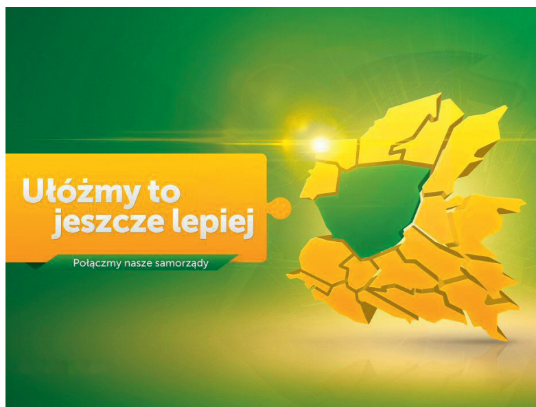
Ryc. 10. Plakat i hasło promujące Kontrakt zielonogórski

W maju 2014 r. Rada Miasta przyjęła Deklarację, w której zobowiązała się do zachowania w strukturze podziału terytorialnego powiększonego Miasta Zielona Góra sołectw istniejących w Gminie Zielona Góra przed połączeniem 12 . Jako załącznik do Deklaracji przyjęto tzw. Kontrakt zielonogórski (rycina 10), w którym wyszczególniono zobowiązania władz miasta w stosunku do mieszkańców gminy Zielona