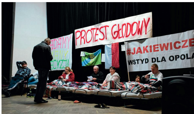
Ryc. 7. Protest głodowy w Dobrzenu Wielkim w grudniu 2016 r.