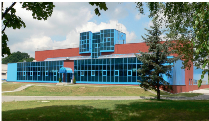
Ryc. 5. Zakład Uzdatniania Wody na osiedlu Zwiężczyca (rozbudowa i modernizacja 167,5 mln zł)