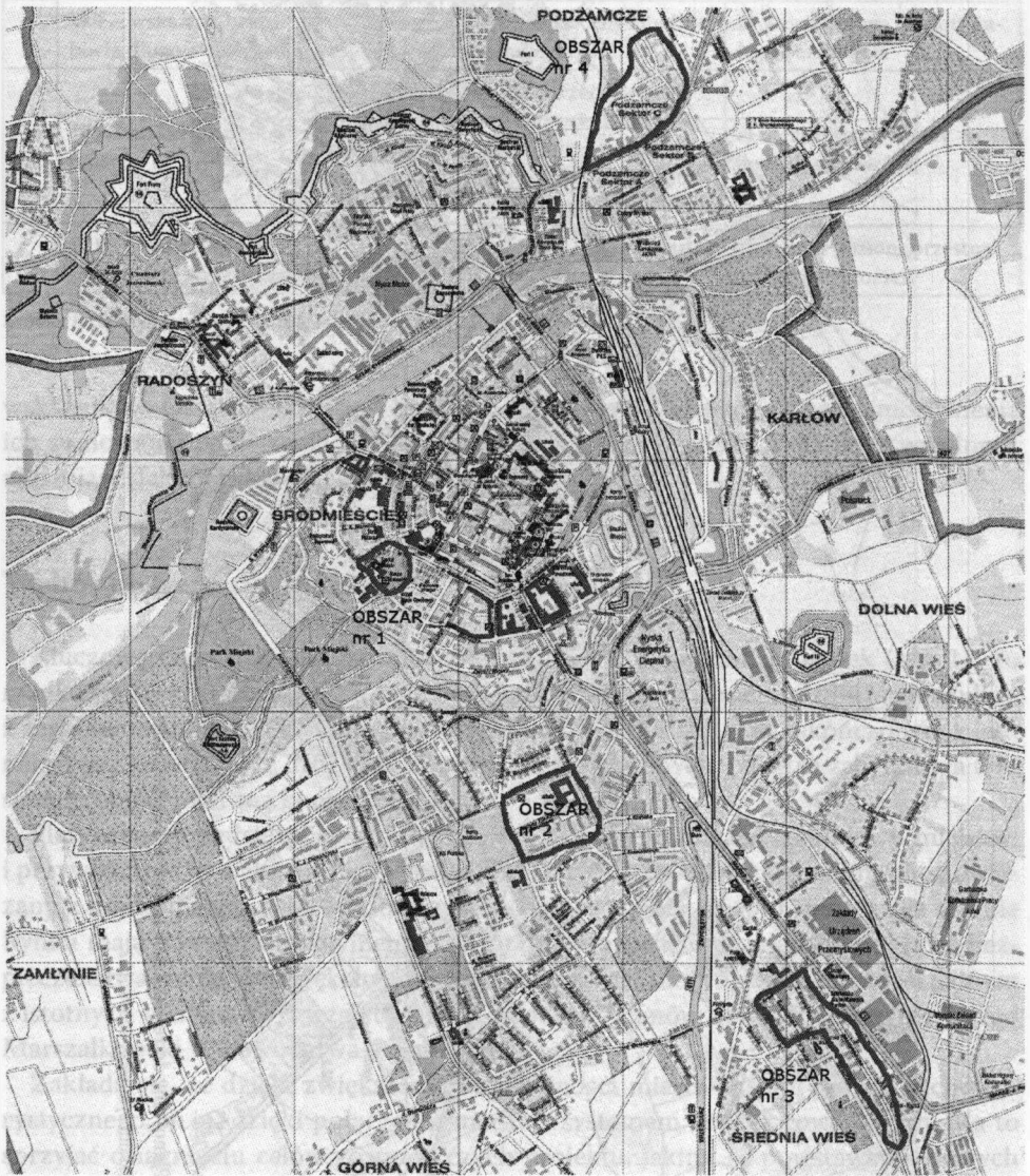
Rys. 2. Obszary wybrane do rewitalizacji w Nysie

W wyniku tych działań wytypowano trzy obszary rewitalizacji. Jeden w centrum miasta, drugi w pewnej odległości od centrum oraz trzeci całkowicie peryferyjny. Czwarty proponowany obszar został ostatecznie odrzucony (rys. 2). W każdym z przewidzianych do rewitalizacji obszarów przewidziano do realizacji jeden projekt.