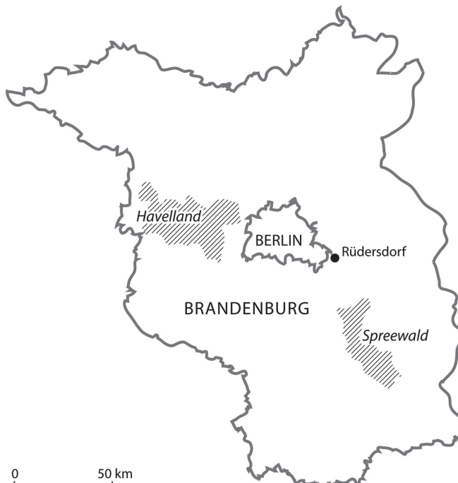
Rys. 1. Region Berlina z Rüdersdorf, Havelland i Spreewald

Interakcje i w konsekwencji funkcjonalne współzależności są nieuniknione (Woods 2005, s. 29, Gleeson, Low 2000, Adam, Wacker 2009). Na przykład w czasie procesu industrializacji Berlina niezbędny rozwój metropolii gwarantowały materiały budowlane z Rüdersdorf oraz warzywa i owoce z Havelland i Spreewald w regionie brandenburskim.