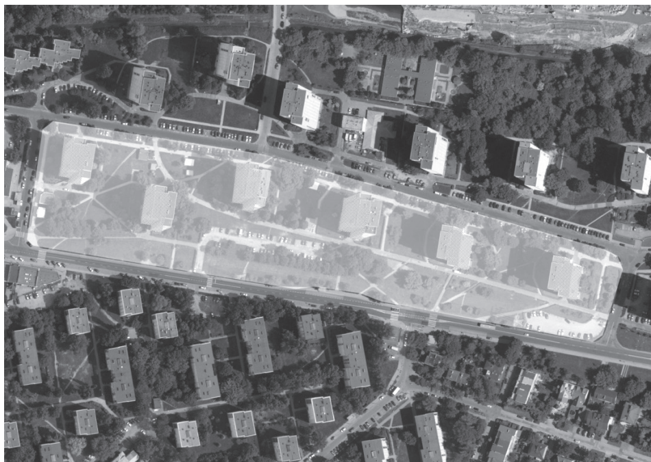
Rys. 1. Uproszczona analiza przestrzenna typowego osiedla wielkopłytowego (Sadyba, Warszawa) – 6 bloków mieszkalnych zajmuje zaledwie 8% powierzchni między ciągami kołowymi (białe cieniowanie). Program usługowy otoczenia jest ograniczony, rozwija się dopiero z upływem lat funkcjonowania osiedla.

Pod względem technicznym osiedla socmodernistyczne w znacznym stopniu powiększyły schematy modernizmu. Tak jak w przypadku zachodniego odpowiednika cechowało je zwiększenie zagęszczenia osadnictwa w połączeniu z większym rozproszeniem przestrzennym zabudowy. Efekt ten uzyskano dzięki wdrożeniu w większym zakresie budownictwa wysokościowego. Cechą charakterystyczną polskiego socmodernizmu było wprowadzenie na pewnym etapie właściwie wyłącznie dwóch skal wysokościowych – pięcio- i jedenastokondygnacyjnych bloków mieszkalnych. Ułatwiało to uzyskiwanie wolnych przestrzeni, jednak wadą takiego rozwiązania był często ograniczony program funkcjonalny, nieobejmujący przestrzeni rekreacyjnej (rysunek 1). Przeważnie nie planowano też zielonej infrastruktury 5 .