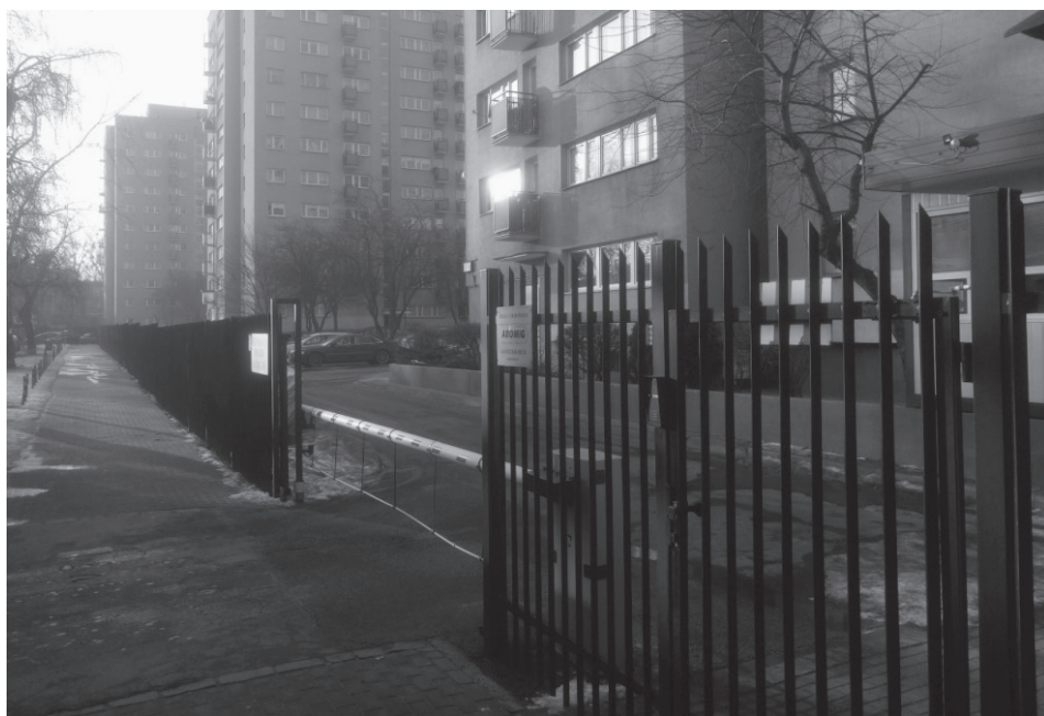
Rys. 3. Zmodernizowane osiedle wielkopłytowe poddane „wtórnemu” grodzeniu (Mokotów, Warszawa)

Osiedla socmodernistyczne jako stanowiące liczną grupę w polskim zasobie mieszkaniowym nie mają szansy zniknąć z krajobrazu rodzimej przestrzeni zurbanizowanej jeszcze przez wiele dekad. Sytuacja ta niesie za sobą konieczność dalszego utrzymania blokowisk oraz refleksji nad możliwościami ich konserwacji, niekiedy zaś rewitalizacji. Procesy te następują zarówno w wyniku zorganizowanych interwencji, także ze strony organizacji społecznych, jak i w sposób oddolny i spontaniczny, pod postacią działań spółdzielni, wspólnot i innych, mniej sformalizowanych grup mieszkańców. Działania te ułatwiła deregulacja polityki mieszkaniowej związana z urynkowaniem tej sfery, zwiększająca dostępność różnorodnych materiałów budowlanych. Negatywną stroną tego zjawiska jest powszechna degeneracja estetyczna (znana przede wszystkim pod postacią nieudolnie przeprowadzanej termomodernizacji i malowania blokowisk w tzw. pastelozę) czy wzmaganie się procesów segregacji przestrzennej. Blokowiska podążają w tym zakresie śladem inwestycji deweloperskich, w karykaturalny sposób upodabniając się do grodzonych osiedli za pomocą licznych barier przestrzennych, wpisujących się w próby pozyskania dla realnosocjalistycznych „mrówkowców” odpowiednich cech prestiżu i bezpieczeństwa, kojarzonych najczęściej z osiedlami zamkniętymi powstającymi już po 1989 r. (rysunek 3). Osiedla z lat 70. i 80. XX w. stoją jednak