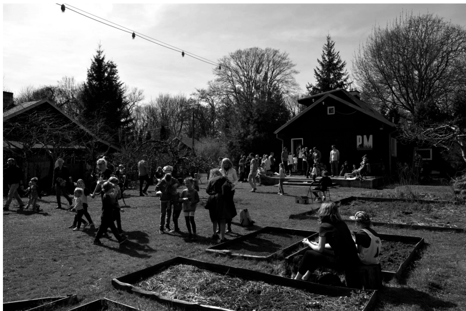
Ryc. 4. Domek nr 3/12 – PM na Trawie