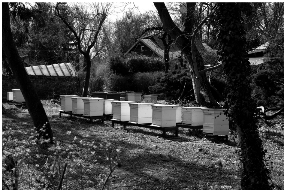
Ryc. 5. Miejskie Pszczoly (pasieka przy domku nr 3/8)