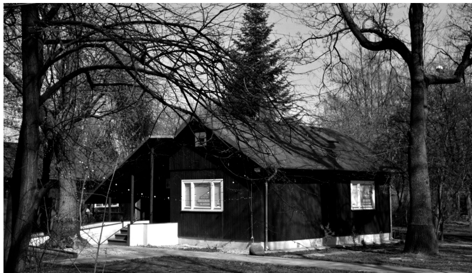
Ryc. 3. Jeden z zachowanych domków – obecnie Rotacyjny Dom Kultury

Osiedle 90 drewnianych domków fińskich na warszawskim Jazdowie oddano do użytkowania w 1945 r. Prefabrykowane części domków przekazał zniszczonej stolicy Związek Radziecki, który stał się ich posiadaczem w wyniku realizacji reparacji wojennych przez Finlandię. Pochodzenie domków utrwalone zostało w nieformalnej nazwie osiedla (Kunceka, Kunecki 2015). W domkach zakwaterowano głównie pracowników Biura Odbudowy Stolicy. Planowany okres ich eksploatacji ustalono na 10 lat (Majewski 2011). Po upływie dekady domki były jednak dalej użytkowane w celach mieszkaniowych (mieszkania komunalne), ale temat ich rozbiórki wracał. Przykładowo w tygodniku „Stolica” z 1963 r. ukazał się artykuł o nowym projekcie zagospodarowania m.in. obszaru kolonii domków na Jazdowie. Zapisano w nim „Domki fińskie na Ujazdowie w początkach roku 1945 były bezcennym skarbem w zniszczonej Warszawie. Niedługo ustąpią śmiałym budowlom miasta nowoczesnego” ( Od Placu... 1963, s. 5). W związku z realizowanymi inwestycjami domki sukcesywnie więc rozbierano (budowa ambasad, Trasy Łazienkowskiej). Miasto prowadziło też nastawioną na dekapitalizację osiedla politykę wobec najemców domków, polegającą m.in. na braku większych remontów i napraw w obiektach. Znaczną część prac na własny koszt wykonywali ich mieszkańcy (wywiad