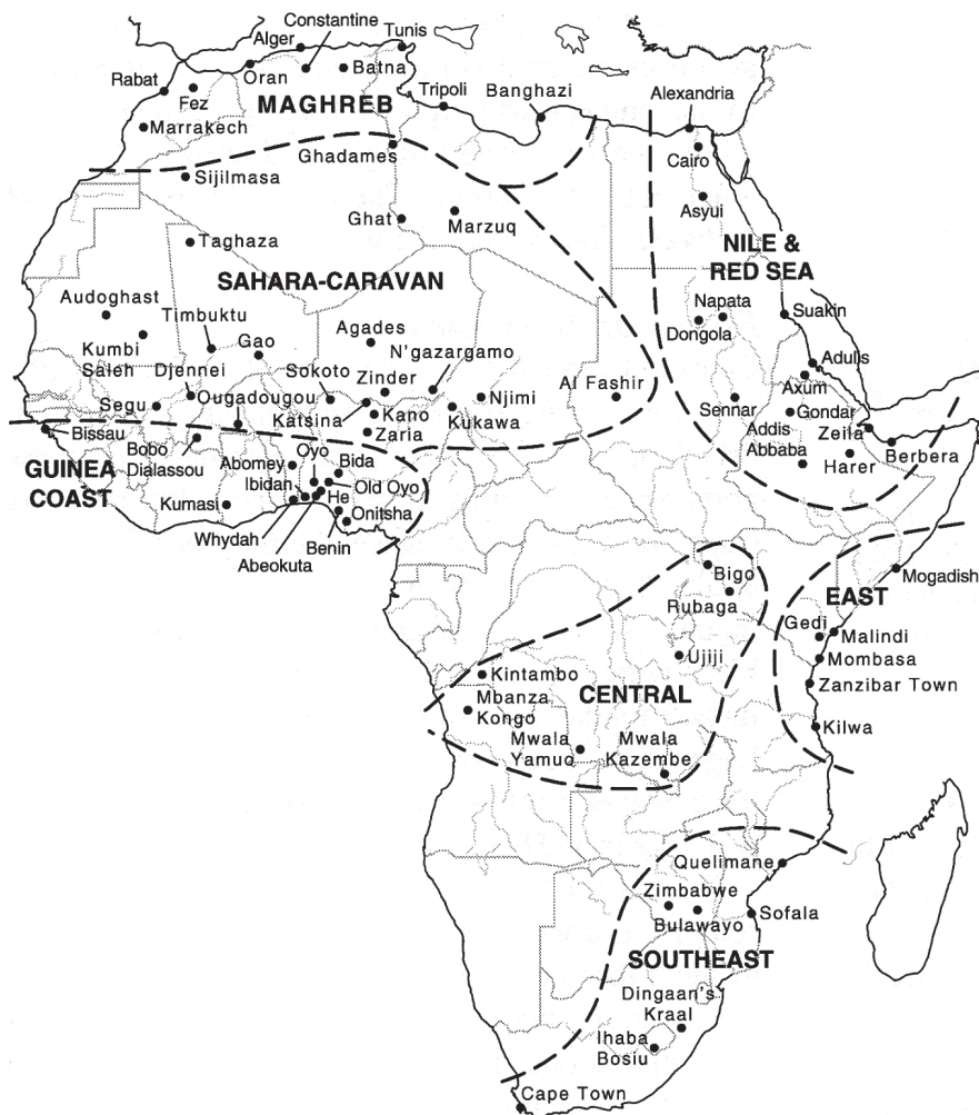
Ryc. 1. Historyczne ośrodki urbanizacji w Afryce przed kolonizacją

Źródło: Mehretu 1993 (za: Kaplan, Wheeler, Holloway 2004).