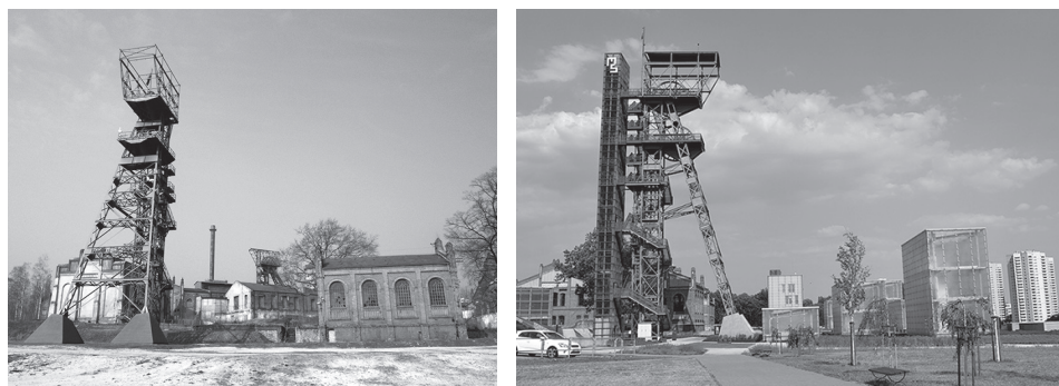
Ryc. 2. Obszar dawnej Kopalni „Katowice” przekształcony w Katowicką Strefę Kultury: A – stan przed rewitalizacją (marzec 2011 r.) – widok od strony południowej; B – stan po rewitalizacji (Muzeum Śląskie w Katowicach) – widok od strony zachodniej

O ile na poziomie ogólnomiejskim odnotowano względną równowagę między sektorem egzo- i endogenicznym (Gwosdz 2014), o tyle na poziomie wewnątrzmijskim zaznaczają się historyczne dysproporcje w zakresie lokalizacji inwestycji gospodarczych. Należy pamiętać o tym, iż rewitalizacja wielu obiektów przemysłowych tak