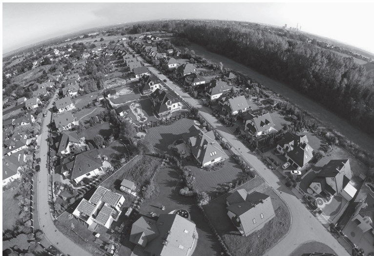
Ryc. 6. Osiedle Malinowice w gminie Psary