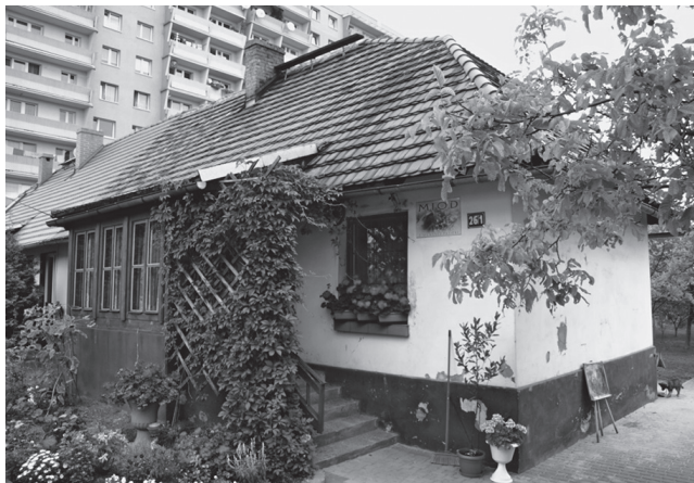
Ryc. 5. Dawny i nowy Giszowiec – tradycyjna zabudowa osiedla na tle zabudowy blokowej