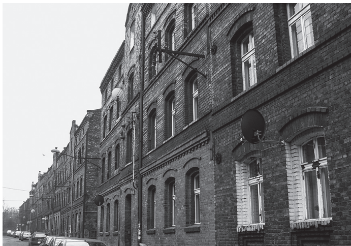
Ryc. 3. Zabudowa mieszkaniowa w dzielnicy Załęże

południową (Węclawowicz 1988). Uformowanie się obszaru śródmiejskiego w dużej części praktycznie w strefie intensywnego rozwoju osadnictwa przyfabrycznego rzutowało na niską jakość warunków mieszkaniowych, a tym samym niezbyt korzystny wizerunek centralnych obszarów miasta. Ich robotniczy charakter w wielu miejscach przetrwał praktycznie do dziś, niezależnie od prób modernizacji bądź rewitalizacji niektórych osiedli, np. dzielnicy Załęże (ryc. 3). Także ulice dobiegające do śródmieścia od strony Chorzowa czy Mysłowic, poza niewielkimi fragmentami w ścisłym centrum, zachowały swój dawny, robotniczy charakter. Słabe warunki zamieszkania w tej części miasta oraz znaczne ograniczenie liczby miejsc pracy w przemyśle (w warunkach transformacji ustrojowej, wejścia Polski do struktur UE i otwarcia zachodnich rynków pracy) skłaniały do emigracji (odpływu) częściej niż z innych obszarów miasta. W rezultacie śródmieście i dzielnice północne wykazują największy spadek zaludnienia (ryc. 4).