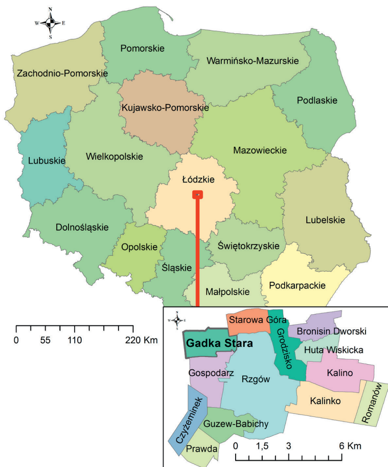
Ryc. 1. Położenie administracyjne Starej Gadki w gminie Rzgów w powiecie łódzkim wschodnim w województwie łódzkim na tle Polski

sąsiadujące, oraz w postępującym procesie zespalandia suburbiów z miastem centralnym (Harańczyk 2015, s. 86). Suburbanizacja najintensywniej obejmuje obszary wokół dużych aglomeracji (jednak także współczesne suburbia powstają wokół średnich i małych miast polskich (Kajdanek 2009, s. 23; 2012, s. 9). Sposób i tempo rozwoju strefy podmiejskiej są cechami indywidualnymi, leżącymi w gestii władz gminnych, a najbardziej w rękach samych zainteresowanych zamieszkaniem z dala od centrum miasta. Przedmieścia stają się coraz chętniej wykorzystywanymi miejscami nie tylko do zamieszkania, ale także do powstawania nowych miejsc pracy. W artykule ukazany został proces przemian wsi podmiejskiej na przykładzie Starej Gadki położonej w suburban zone Łodzi i bezpośrednio z nią graniczącej (ryc. 1). Zachodzące w tej wsi charakterystyczne przemiany przestrzenno-ekonomiczne ukazują obraz wielu współczesnych suburbiów