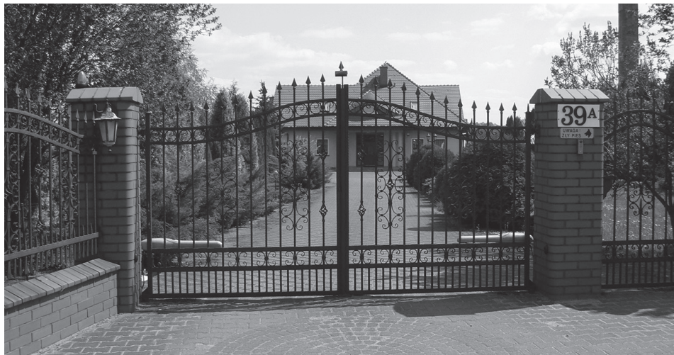
Ryc. 3. Zabudowa rezydencjonalna