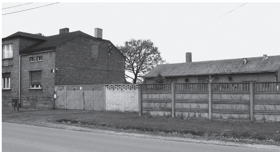
Ryc. 4. Zabudowa zagrodowa