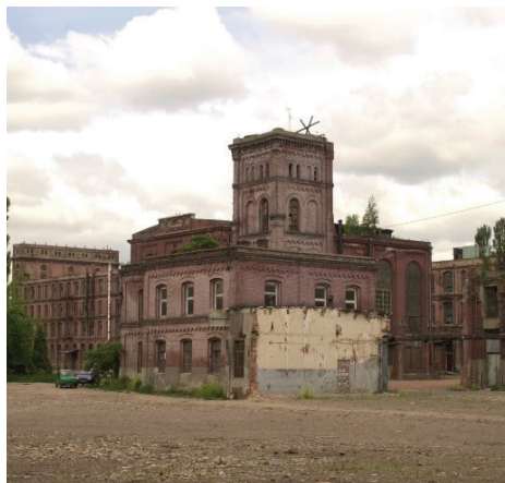
Fot. 3. Dawna remiza strażacka przed pracami remontowymi