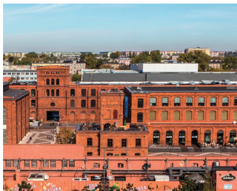
Fot. 6. Fragment kompleksu po ukończeniu prac remontowych

i podkreślenia wyjątkowości tego miejsca, które na stałe zakorzeniło się w łódzkim krajobrazie kulturowym (Chmielewska 2010; Gruszczyńska 2008, 2007).