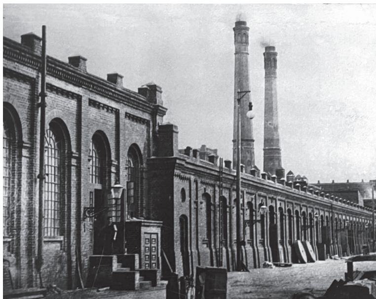
Fot. 1. Fabryka w latach świetności czasów Poznańskiego