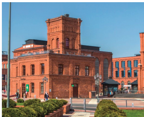
Fot. 7. Dawna remiza strażacka po ukończeniu prac remontowych