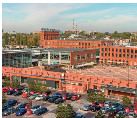
Fot. 8. Dawny budynek przędzalni z widokiem na pasaż handlowy po pracach remontowych