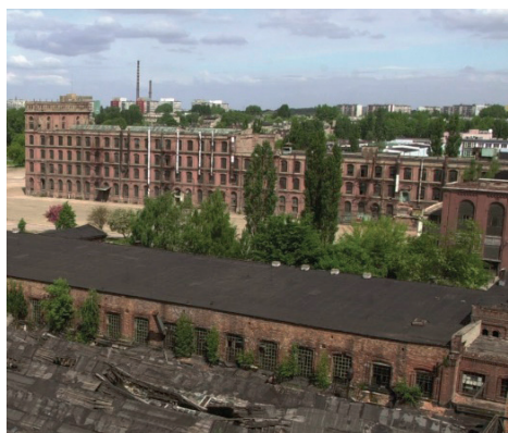
Fot. 4. Dawny budynek przędzalni przed pracami remontowymi