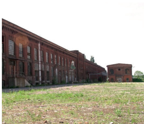
Fot. 5. Dawny budynek tkalni przed pracami remontowymi