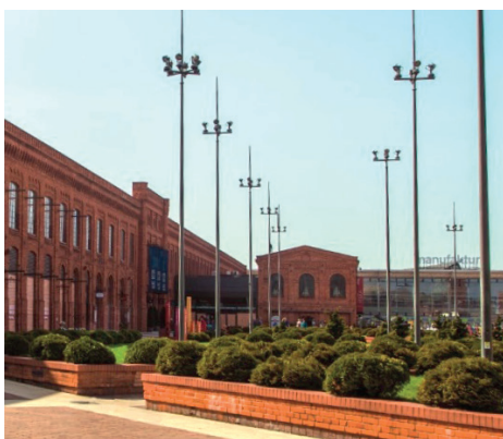
Fot. 9. Dawny budynek tkalni po ukończeniu prac remontowych