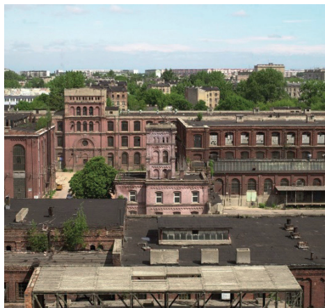
Fot. 2. Fragment kompleksu przed pracami remontowymi

Lata 1997–2000 były przełomowe dla samego kompleksu, jak również dla społeczności miasta. Niszczący obiekt dotąd zakład pracy, w pewnym momencie stał się czymś bez wartości dla ogółu. Jednym z podstawowych i największych problemów, które w tym okresie powiększyły swój zakres, było bezrobocie. Jak pisze Kubiak (2019), ostatniego dnia pracy w Poltexie „łódzkie włóknianki z placem opuszczały mury daw-