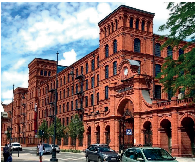
Fot. 10. Wejście do Manufaktury od ul. Ogrodowej

Projekt Manufaktury przywrócił do przestrzeni publicznej dawną zdegradowaną fabrykę, generując w Łodzi duże zainteresowanie terenami postindustrialnymi oraz dziedzictwem poprzemysłowym. Świadomość społeczna i postrzeganie tego dziedzictwa ewoluowało: z niechcianego i zapomnianego, do wartościowego i ważnego dla społeczności lokalnej.