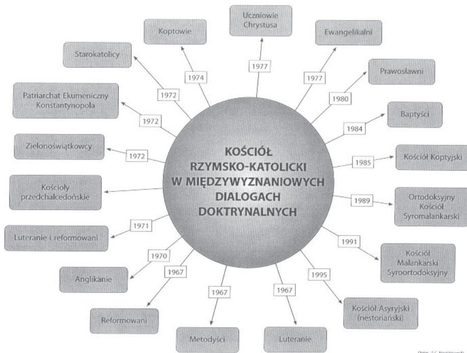
Dialogi podjęte do 1995 roku

bez ekumenicznej satysfakcji podzieliłem się ekumeniczną mądrością dialogu z dzieckiem świeckiego świata.